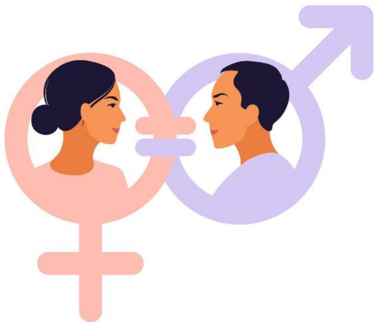
Porcentaje de personal con estereotipos de género